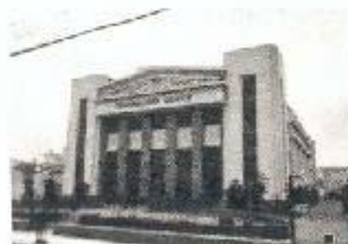
Sede Filial -- São Paulo