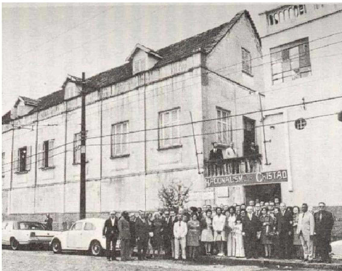
Despedida da antiga sede, construída em 1943, à rua Francisca Júlia, 28 – Alto de Santana

Constituiu-se verdadeira apoteose a tarde de domingo do dia 25 de novembro de 1973, a começar pelas cerimônias no jardim, em frente ao novo edifício.