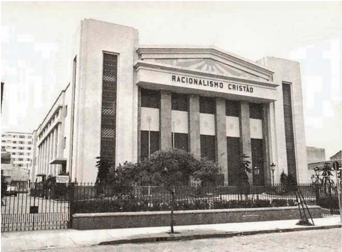
Sede da Filial São Paulo, em Santana, São Paulo