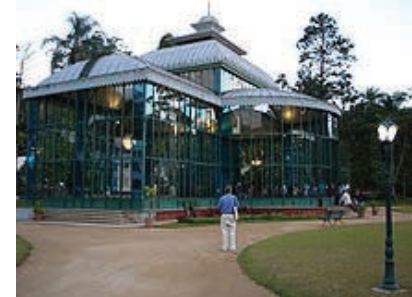
Palácio de Cristal

Nesta edição, Brasil Interior abre espaço para falar um pouco da bonita Petrópolis (RJ), que ocupa uma área de 774,606 km 2 , contando com uma população de 312.766 habitantes, de acordo com IBGE (2008). De clima ameno, as construções históricas e a abundante vegetação são grandes atrativos turísticos.